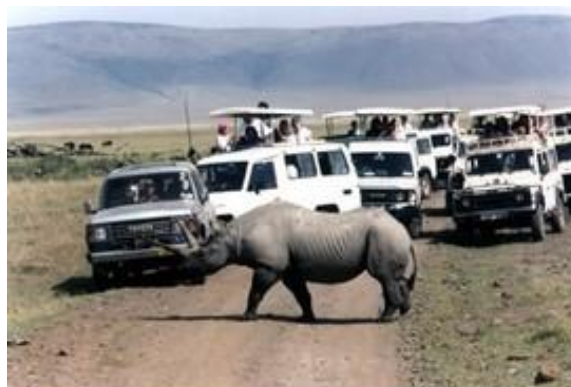
Black rhino is a traffic-stopper in Ngorongoro Crater.

*Kifaru mweusi huzuia magari barabarani katika Hifadhi ya Ngorongoro.